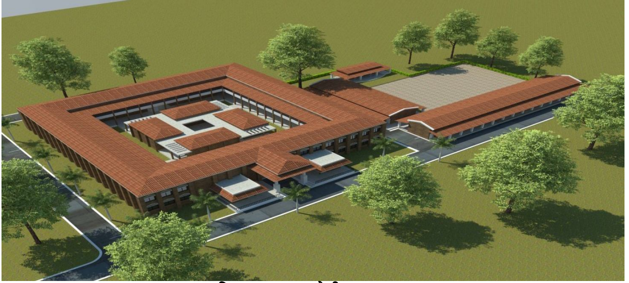
विद्याअरण्यम् शाळेची मुख्य इमारत

विद्या-अरण्यम् आपली शैक्षणिक सुविधा आगामी सत्रात जून २०१९ पासून पूर्व-प्राथमिक व प्राथमिक (इयत्ता १ ली ते ८ वी) इंग्रजी आणि मराठी माध्यमात शैक्षणिक सेवा विस्तारित आहे.